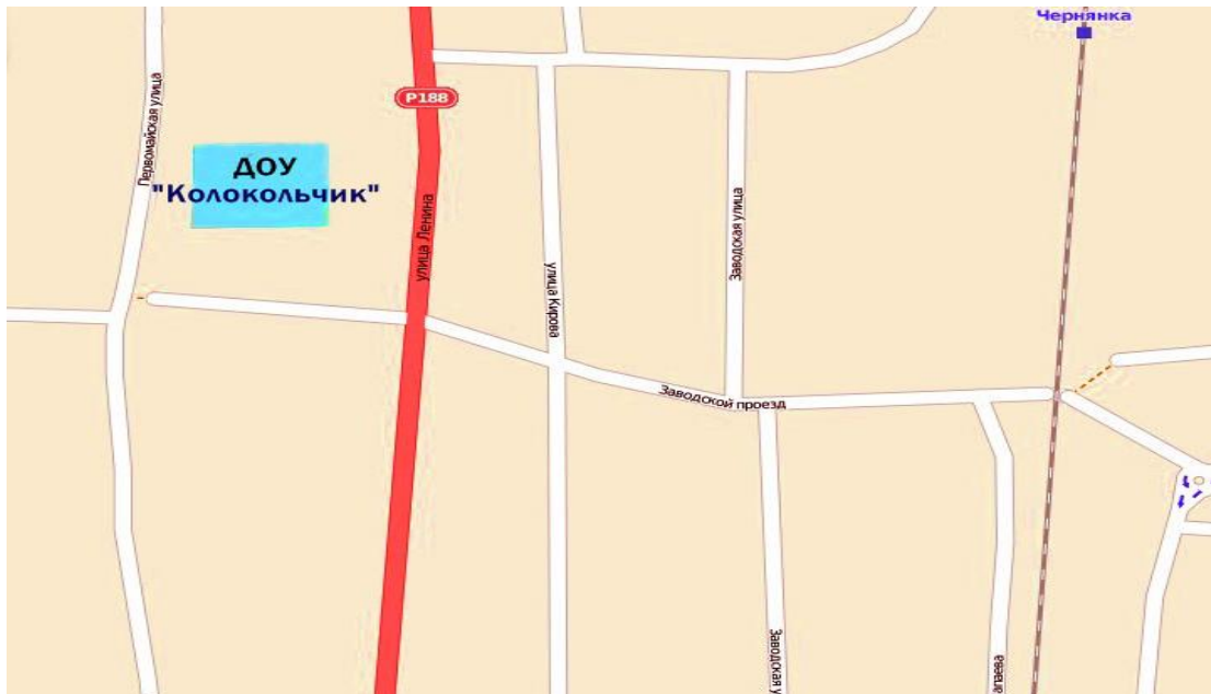
Схема дорожной безопасности МБДОУ «Колокольчик» п. Чернянка